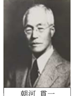
朝河 貫一 (現 立安積 中 高 校)